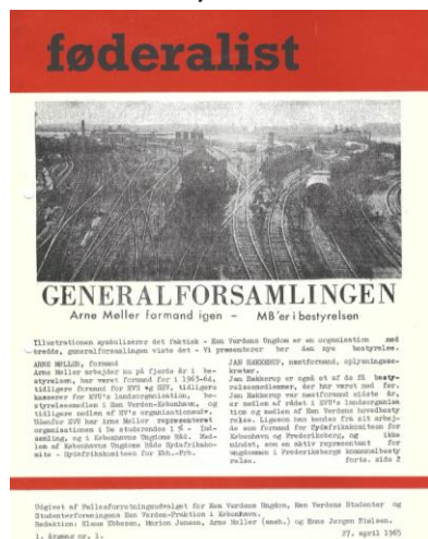
Billede 13.9: Første nummer af det ulovligt udsendte blad Føderalist .

Forfatteren har ikke fundet kopi af nr. 2, der indeholdt de omtalte urigtige påstande.