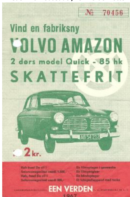
Billede 11.3: Lodseddel, Een Verden lotteri 1967