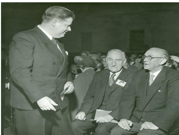
Billede 5.6: Per Hækkerup, MF, hilser på to ledende britiske verdensføederalister, Lord Boyd Orr og Clement Davies, MP.