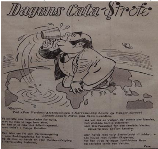
Billede 5.2: Dagens-Cata-strofe vedr. mundialisering af Horsens-Hammer kommune

(Cata er pennavn for Erling Fischer).