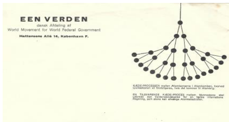
Billede 1.1: Medlemshvervnings kæde proces

Tidligt i forsøget på at øget medlemstallet i slutningen af 1940'erne producerede en kædeproces model, der skulle tilskynde medlemmerne til at skaffe medlemmer.